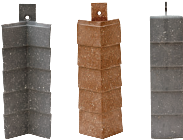
Nurkka- ja liitospaloja on saatavilla kaikissa paneelin väreissä.

Kiinnitetään vaakatasossa tavalliseen koolaukseen.