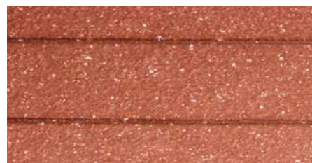
nach der Bewitterung